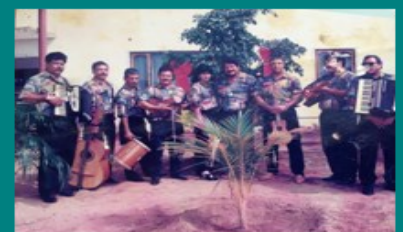
Tipico del Campo